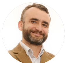
Odilon Borges Future Law