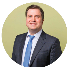
Helder Galvão Abreu Advogados