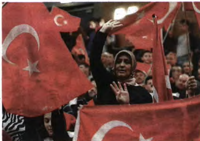
Os turcos têm receio do que lhes vai acontecer após o referendo

E foram atribuídas 7396 autorizações de residência a familiares reagrupados.